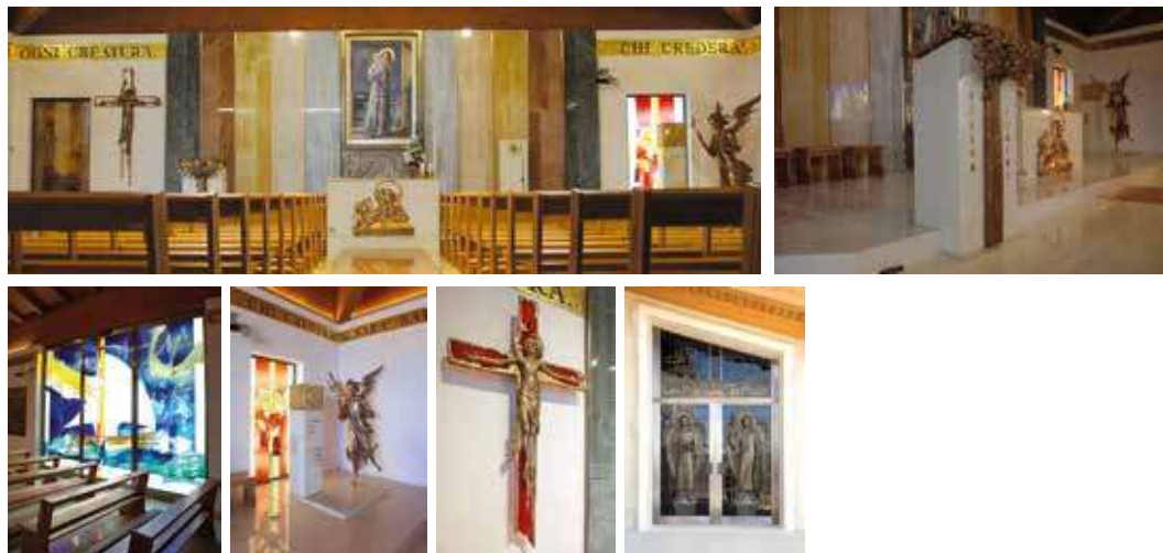
Foto: la zona presbiteriale; gli arredi liturgici, una delle vetrate; il tabernacolo con la scultura dell'angelo e la vetrata; il crocifisso in bronzo; il portale d'ingresso in vetro e bronzo.

Opere realizzate: portale d'ingresso in bronzo e vetro, fondale del presbiterio con arredi liturgici, tabernacolo e scultura in bronzo di San Gabriele, croce in bronzo e vetro, vetrate artistiche (2008)