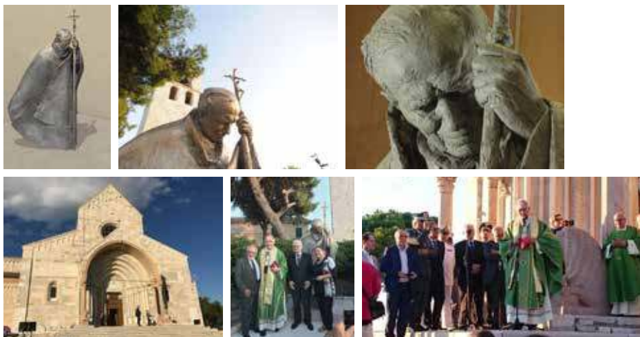
Foto: scultura in bronzo, dettaglio della plastilina, esterno della cattedrale, alcuni momenti dell'inaugurazione con il Card. Edoardo Menichelli.

Opere realizzate: scultura in bronzo raffigurante Santo Papa Giovanni Paolo II (2017)