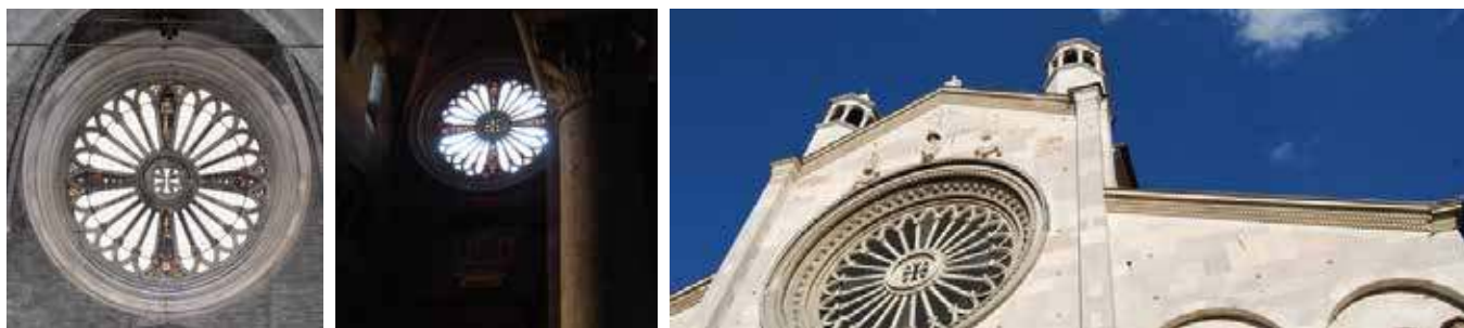
Foto: il rosone restaurato.

Opere realizzate: restauro del rosone di facciata (2008)