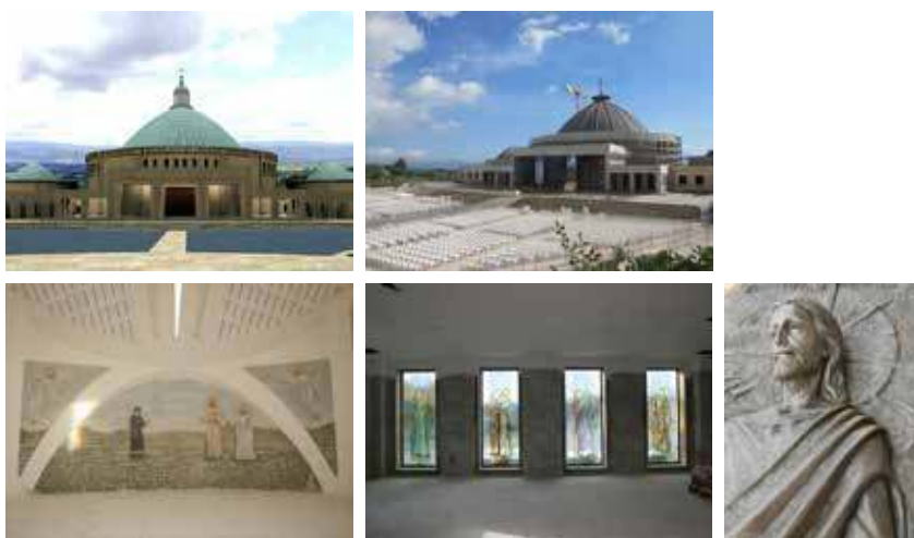
Foto: progetto della chiesa, il cantiere della chiesa in costruzione, il mosaico del presbiterio, alcune delle vetrate e un particolare del portale in bronzo.

Opere realizzate: mosaico, vetrate artistiche e portale in bronzo (2015)