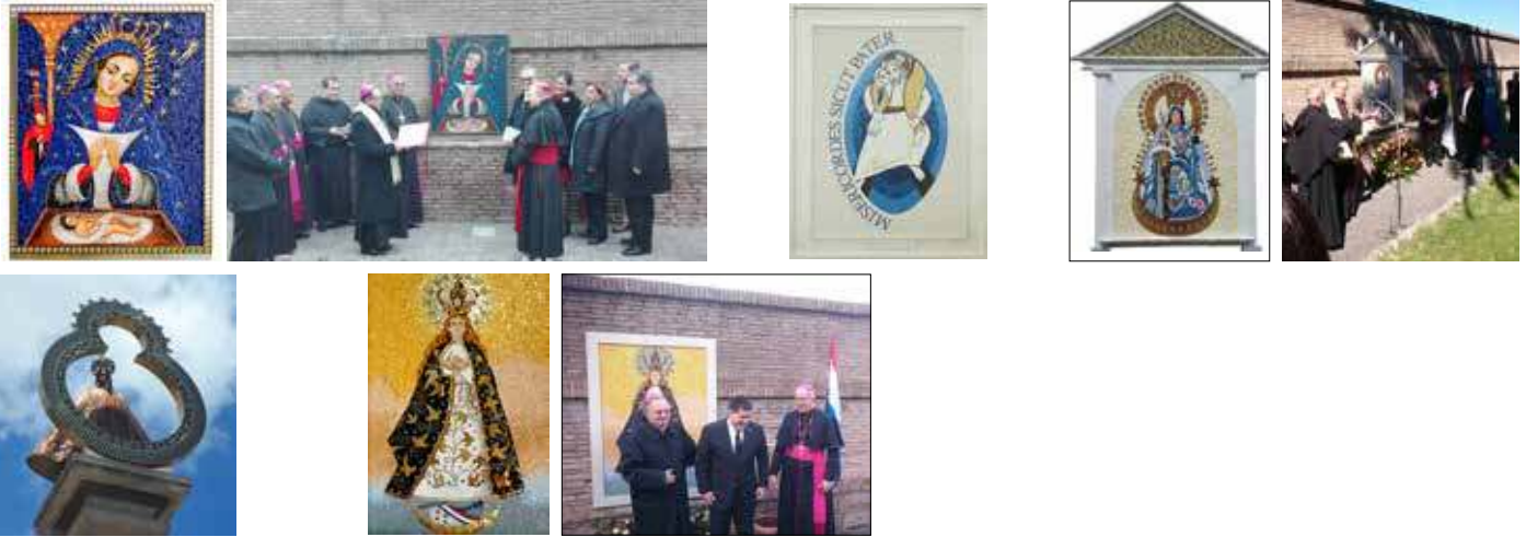
Foto: Il mosaico raffigurante la Vergine di Altigracia e un momento dell'inaugurazione; il mosaico raffigurante il simbolo del Giubileo della Misericordia voluto da Papa Francesco; il mosaico della Madonna di Copacabana per l'Ambasciata della Bolivia; la scultura restaurata su commissione dell'Ambasciata dell'Honduras; il mosaico commissionato dall'Ambasciata del Paraguay, Card. G. Bertello (Presidente del Governatorato del Vaticano) Horatio Cortes (Presidente del Paraguay) e Mons. E. Valenzuela Mellid (Presidente Conferenza Episcopale del Paraguay) durante l'inaugurazione.

Opere realizzate: mosaico commissionato dall'Ambasciata Domenicana raffigurante la Vergine di Altigracia, mosaico con il simbolo del Giubileo, mosaico della Madonna di Copacabana per l'Ambasciata della Bolivia, restauro di una scultura in bronzo per l'Ambasciata dell'Honduras, mosaico commissionato dall'Ambasciata del Paraguay. Tutte le opere sono collocate all'interno dei Giardini Vaticani (2016-2017)