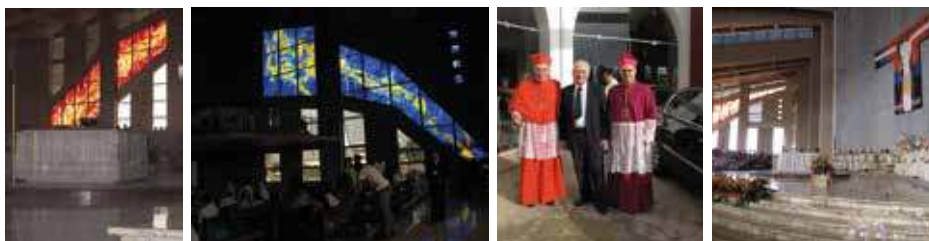
Foto: le vetrate realizzate; il Card. G.B. Re con il nunzio apostolico L.Baldisseri e Albano Poli, un momento della celebrazione di inaugurazione.

Opere realizzate: vetrate artistiche (2011)