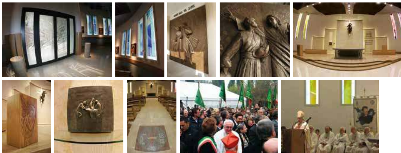
Foto: porta d'ingresso in vetro inciso; vetrate artistiche; portale in bronzo; vetrate artistiche del presbiterio; ambone in legno; tabernacolo in bronzo; mosaico a pavimento; il Card. D. Tettamanzi e il sindaco di Milano Moratti in occasione dell'inaugurazione; un momento della celebrazione.

Opere realizzate: portale in bronzo, fondale del presbiterio con tabernacolo, sedi e ambone in legno, vetrate artistiche (2010)