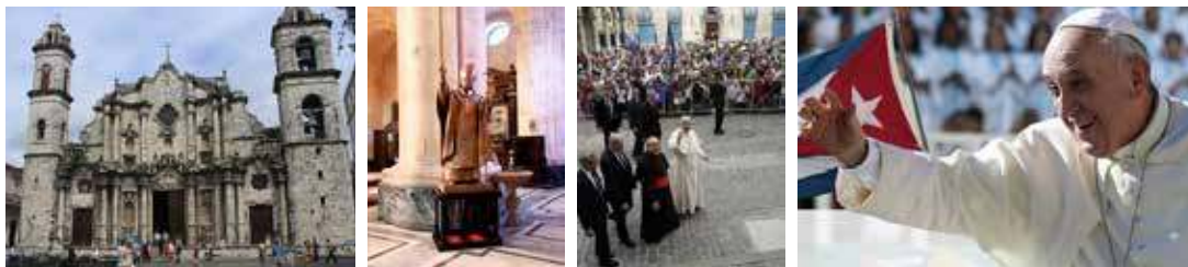
Foto: l'esterno della cattedrale, la scultura in bronzo, Papa Francesco durante la visita a Cuba

Opere realizzate: scultura in bronzo di Papa Giovanni Paolo II (2015)