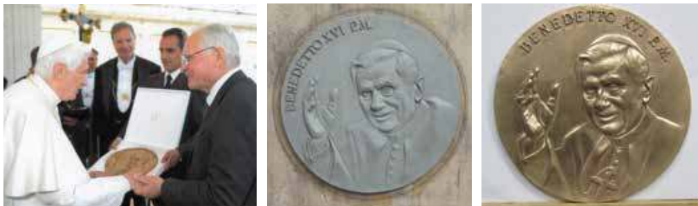
Foto: un momento dell'incontro tra Papa Benedetto XVI ed Albano Poli; plastilina dell'opera; la medaglia in bronzo.

In occasione del settimo anniversario di Pontificato e dell'ottantacinquesimo genetliaco di Papa Benedetto XVI, Albano Poli ha consegnato al pontefice una medaglia in bronzo in segno di ammirazione e stima verso la sua persona ed il suo operato.