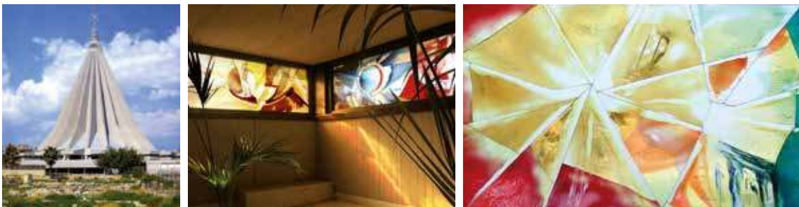
Foto: l'esterno del santuario e alcune delle vetrate realizzate.

Opere realizzate: vetrate artistiche in vetro soffiato (2003)