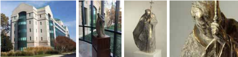
Foto: l'esterno della sede a Washington e la scultura in bronzo

Opere realizzate: scultura in bronzo di Papa Giovanni Paolo II (2015)