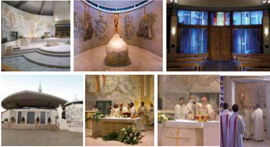
Foto: il presbiterio con i nuovi arredi liturgici, zona del fonte battesimale con i mosaici e la scultura in bronzo; portale d'ingresso con vetrate artistiche; portali in bronzo esterni; il Card. C. Ruini durante la consecrazione dell'altare; il Card. A. Vallini durante la benedizione del fonte battesimale.

Le opere realizzate per la Chiesa di Gesù Divino Maestro hanno ottenuto il premio Faith&Form Awards 2011.