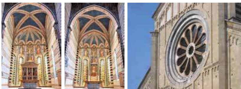
Foto: le vetrate dell'abside; vista delle vetrate senza la Pala del Mantegna; il rosone di facciata.

Opere realizzate: vetrate di abside, restauro del rosone di facciata con nuovo telaio (2009-2012)