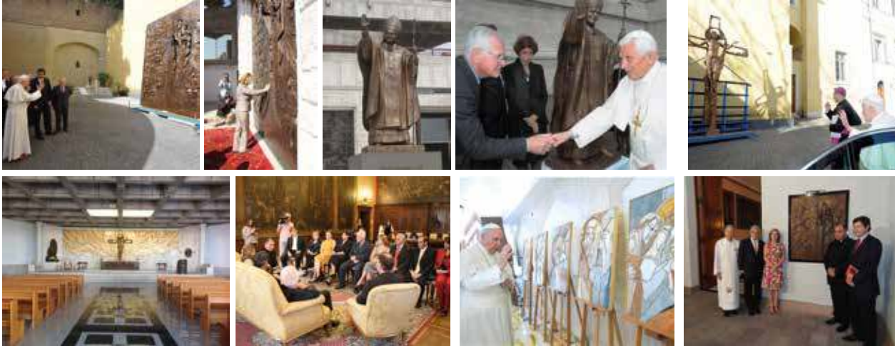
Foto: Papa Benedetto XVI benedice uno dei portali; Cecilia Morel (moglie del Presidente del Cile) apre il portale durante l'inaugurazione; la scultura in bronzo raffigurante Papa Giovanni Paolo II; Albano Poli con Papa Benedetto XVI in occasione della benedizione della scultura; Papa Benedetto XVI benedice il crocifisso in bronzo; l'abside con il mosaico ed il crocifisso; la delegazione cilena in visita a Verona presso le sale del comune; Papa Francesco benedice la Via Crucis in bronzo; una miniatura in bronzo del portale è stata collocata presso il Palazzo Presidenziale.

Croce del Terzo Millennio è un monumento alto 92 m posto sul colle più elevato della città di Coquimbo che accoglierà tutti i fedeli del luogo.