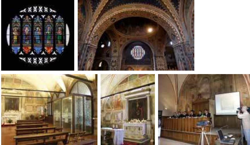
Foto: il rosone meridionale; vetrate e balaustre nella Cappella del Santo, bussola e dipinto nella Sala del Capitolo, conferenza stampa in occasione dell'inaugurazione.

Opere realizzate: restauro del rosone meridionale, vetrate e balaustre Cappella del Santo, bussola e restauro del dipinto nella Sala del Capitolo (2007)