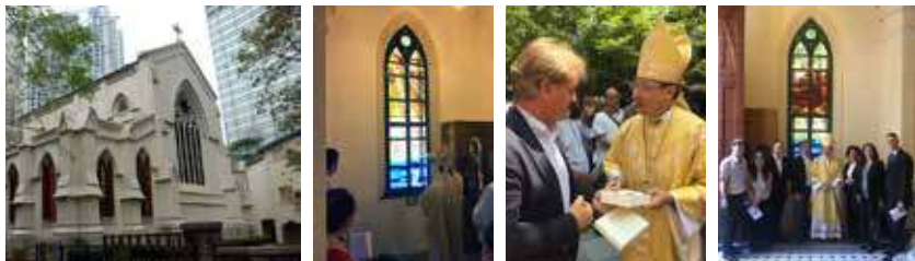
Foto: l'esterno della Cattedrale di S.John, l'Arcivescovo Peter Kwong mentre benedice una delle vetrate; Paolo Poli con l'Arcivescovo Kwong; Paolo Poli con l'Arcivescovo, l'Arch. Anna Kwong e altri architetti che hanno contribuito alla realizzazione delle vetrate.

La Cattedrale di S.John ha una particolare importanza in quanto sorge sull'unica zona di Hong Kong che ancora appartiene all'Inghilterra.