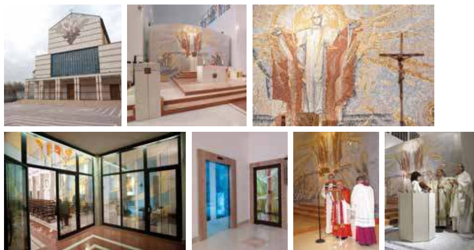
Foto: rivestimento e mosaico di facciata; presbiterio con mosaico e arredi liturgici; particolare del mosaico; bussola e vetrate artistiche; Card. D.Tettamanzi durante la consecrazione dell'altare; il Vescovo ausiliario E.De Scalzi durante l'inaugurazione del fonte Battesimale.

Opere realizzate: riassetto del presbiterio con arredi e mosaico, rivestimento e mosaico di facciata, vetrate artistiche e bussola d'ingresso (2009)