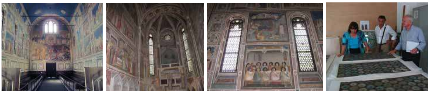
Foto: l'interno della Cappella con le vetrate restaurate; Albano Poli con i responsabili della Soprintendenza durante una visita nel laboratorio di restauro.

Opere realizzate: restauro vetrate (2011)