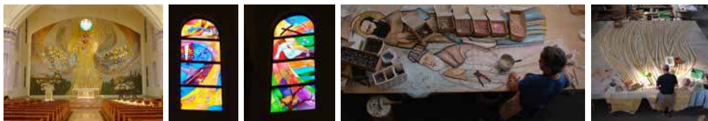
Foto: mosaico del presbiterio, alcune delle vetrate artistiche e alcuni momenti della lavorazione.

Opere realizzate: un mosaico a parete per il presbiterio delle dimensioni di m 14x10h, mosaici degli arredi liturgici e vetrate artistiche (2017)